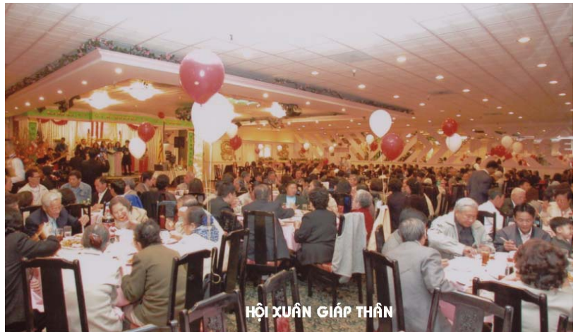
HỘI XUÂN GIÁP THÂN

Mới 7 giờ sáng, không khí còn lành lạnh, những giọt sương mai còn đọng trên cành cây ngọn cỏ, lấp lánh ánh lên như những hạt kim cương dưới nắng mai hồng. Cũng là lúc những thành viên trong Ban Chấp Hành đã lác đác tụ về địa điểm quy định, càng lúc càng đông. Đến 9 giờ hầu như mọi thành viên đã có mặt đầy đủ, ai vào việc nấy như đã phân công, cùng nhau ra sức trang hoàng vị trí ngày Hội.