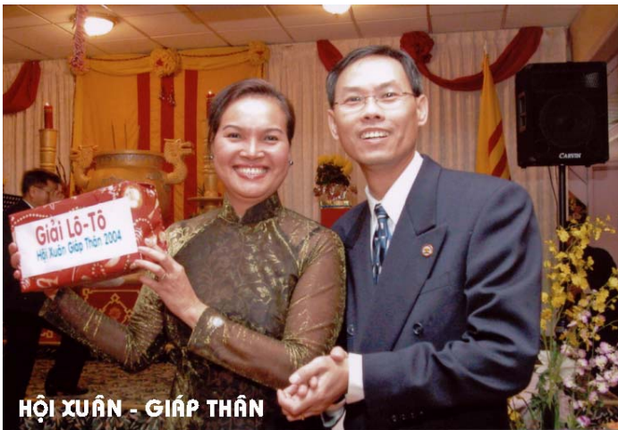
HỘI XUÂN - GIÁP THÂN

Năm nay Hội Xuân có lẽ là một trong những ngày hội tưng bừng, thành công nhất, chương trình sắp đặt chặt chẽ, Đồng hương tham dự thật đông đảo, có lẽ cũng nhờ sự tham dự một số rất lớn đồng hương của Quận Cam, San Bernadino, Riverside, San Diego và nhất là sự hưởng ứng nồng nhiệt của Đồng hương về từ Quận Los Angeles, tình đoàn kết